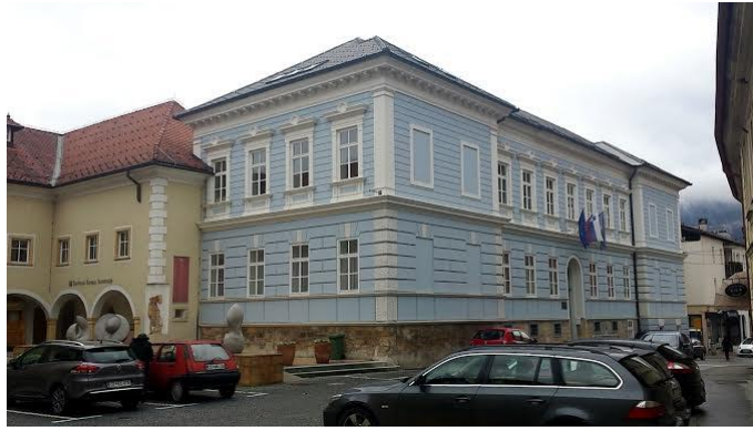
Slika 17: Predhodno slovenska ljudska šola, danes Glasbena šola Laško