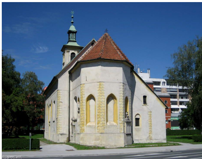
Slika 4: Stolno-opatijska cerkev sv. Danijela Celje

Stolno-opatijska cerkev sv. Danijela je triladijska cerkev, ki stoji na Slomškovem trgu. Na območju srednjeveškega jedra je stala vsaj že v 14. stoletju. Pozneje so jo večkrat prezidali ter povečali. V drugi polovici 19. stoletja so s historičnimi predelavami poskusili zabrisati baročne oblike iz 17. ter 18. stoletja. Celoti so želeli dati gotski značaj. Najbolj opazna elementa tega sta visok neogotski zvonik s koničasto streho iz leta 1877 in podaljšek zakristije s šilastoločnimi okni iz leta 1901.