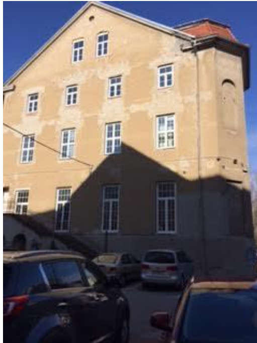
Slika 11 nekdanja ekonomska šola

Šola Vodnikova ulica 10 je nastala leta 1880. Grajena je bila z namenom, da bo uporabljena kot dekliška šola. V 20. stoletju pa so dodali še telovadnico, kapelo in velik prizidek. Tam so bili prostori Ekonomske šole Celje.