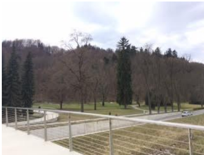
Slika 9: Mestni park Celje

Mestni park je lociran na desnem bregu reke Savinje. Leta 1858 so nastali prvi zametki mestnega parka, ko so nasadili divje kostanje. 1871 je mestna občina Celje kupila to ozemlje in do konca stoletja uredila mestni park. Ob parku je nekaj kavarnic, ki popestrijo dogajanje in povečajo obisk parka.