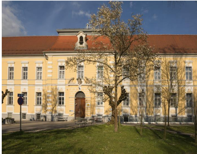
Slika 19: Predhodno Deželna hiralnica Vojnik, danes Psihiatrična bolnišnica Vojnik

rizalitom. Po drugi svetovni vojni so v tej stavbi uredili psihiatrično bolnišnico. Prvotna zasnova je še povsem razvidna, kljub manjšim spremembam.