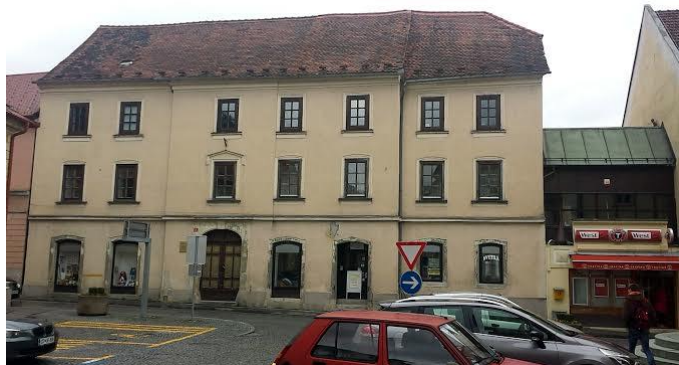
Slika 13: Hiša na naslovu Mestna ulica 4 in 6 Laško