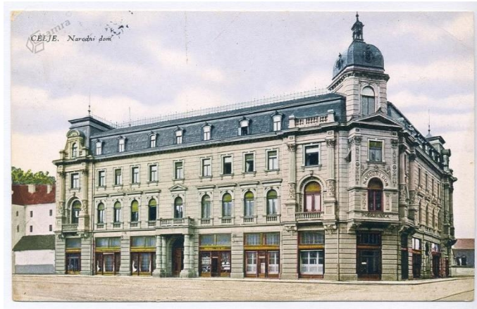
Slika 8: Narodni dom, danes Celjska občina

členitev, s čimer so ji poskušali dati videz nepomembne stavbe. V 20. stoletju so stavbi po razdejanju obuličnega trakta, kakovostno rekonstruirali historično fasadno členitev. Od druge polovice 20. stoletja je v njej sedež celjske mestne občine.