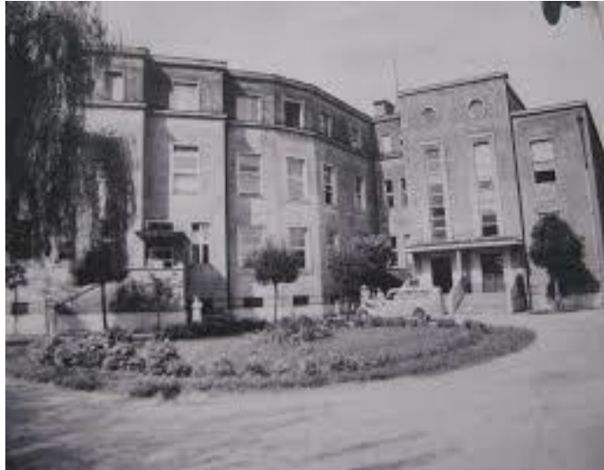
Slika 2: Gizelina bolnišnica Celje