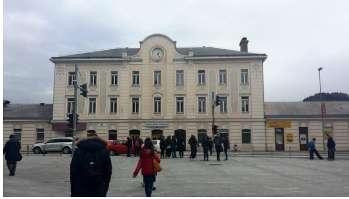
Slika 12: Železniška postaja Celje