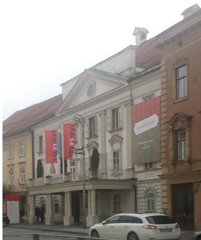
Slika 10: Rotovž Celje

Rotovž stavba je bila pozidana že v 17. stoletju, v 19. pa so jo močno predelali in prenovili ter ji dali funkcijo magistrata. Leta 1840 so glavni fasadi dodali balkon v klasicističnem slogu. Leta 1844 so dodali še uro, ki pa so jo med prvo svetovno vojno odstranili. V 20. stoletju so mestno oblast preselili, nekdanji rotovž pa preuredili za namen muzeja.