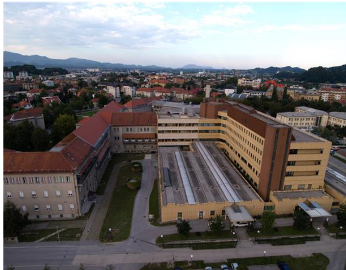
Slika 3: Splošna bolnišnica Celje