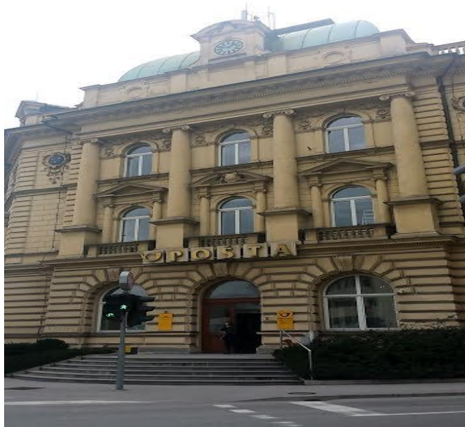
Slika 7: Palača- Pošta Celje