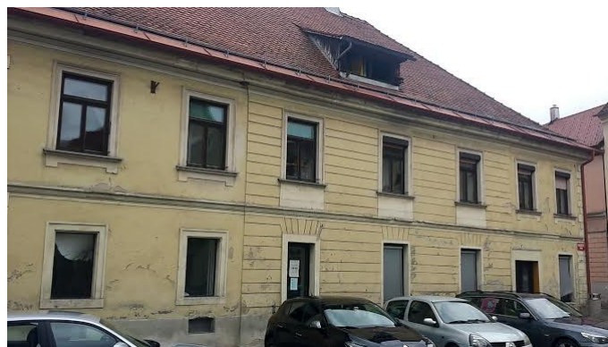
Slika 15: Hiša Valvasorjev trg 8 Laško

Hiša Valvasorjev trg 8 je dolga enonadstropna stavba, ki je na starejši osnovi nastala po letu 1825. Sestavljena je iz več stavbnih enot. V spodnjem nadstropju sta Optika Barbara in Zlatarstvo Guček. V zgornjem nadstropju so stanovanja.