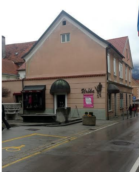
Slika 14: Stavba na naslovu Trubarjeva ulica 2 Laško