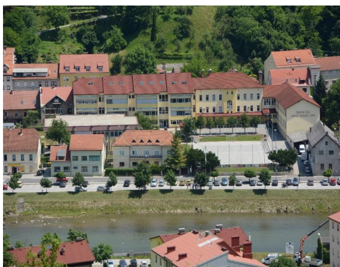
Slika 16: Predhodno nemška ljudska šola, danes OŠ Primoža Trubarja Laško