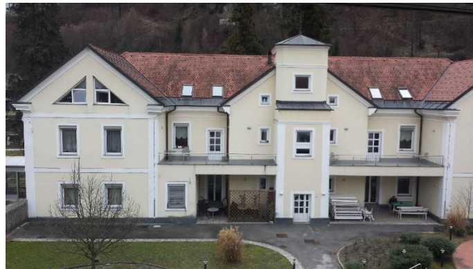
Slika 18: Zdraviliški dom Laško