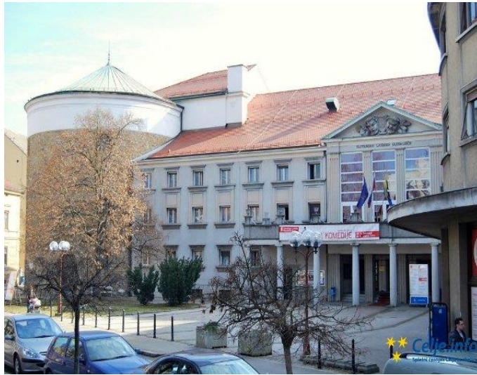
Slika 5: Slovensko ljudsko gledališče Celje

arhitektov Hansa Kamperja in Franca Korenta stavbo temeljito predelali, da je ostala le osnova zgradbe.