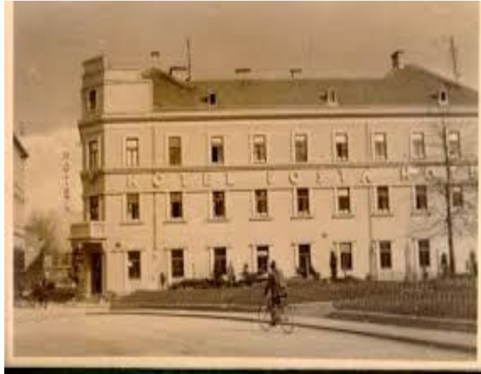
Slika 6: Hotel Pošta Celje